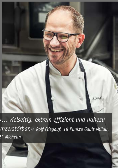
«... vielseitig, extrem effizient und nahezu unzerstörbar.» Rolf Fliegau, 18 Punkte Gault Millau, 2* Michelin