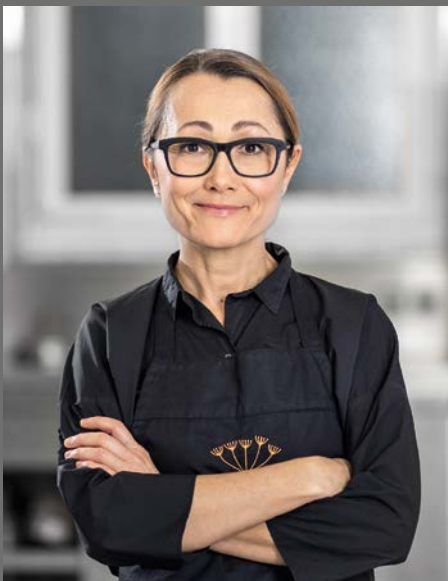
«... gart schonend und sicher, maximiert die Gerichte qualitativ!» Tanja Grandits, 19 Punkte Gault Millau, Koch des Jahres 2020, 2* Michelin